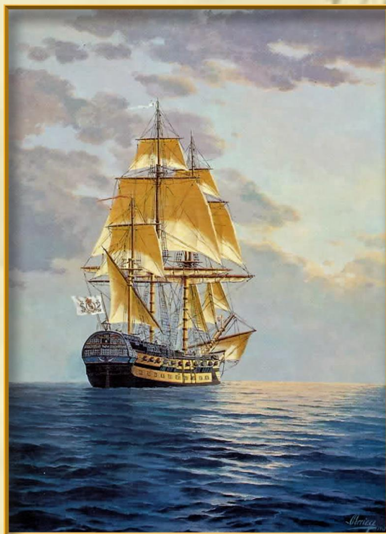
Nuestra Señora del Pilar de Zaragoza

(Óleo sobre lienzo 100x73 realizado por Esteban Arriaga en 1992)